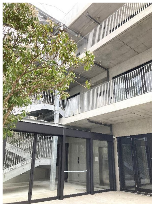
加和太建設のつながりの循環を表した複合拠点 CABO uehara