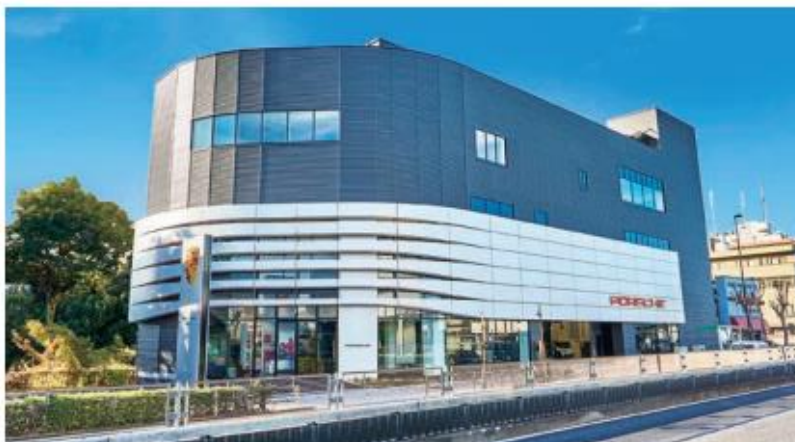
PAIG Japan Automobile Investmentと手がけた東京都足立区の整備拠点 当初計画の3階建てを4階建てに変更したという